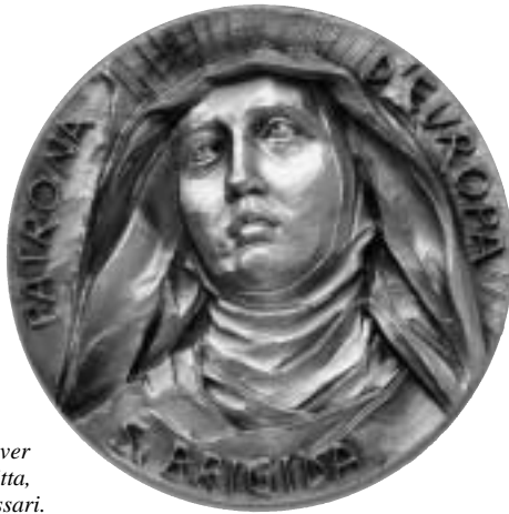
Fig. 3. Medalj över den heliga Birgitta, utförd av Baldessari. Frånsidan visar likheter med medaljongen i Djursholm på föregående sida.