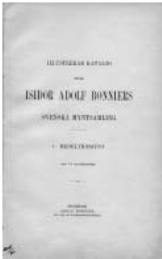
4. Den klassiska Illustrerad katalog öfver Isidor Adolf Bonniers svenska myntsamling. 1. Medeltidsmynt. Stockholm 1904. Själva auktionen dröjde emellertid ända till 26 januari 1906!