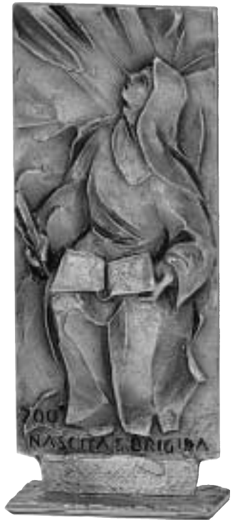
Fig. 4. Tvåsidig plakett på fot, med den heliga Birgitta på den ena sidan och Elisabeth Hesselblad på den andra sidan, av Mauro Baldessari.