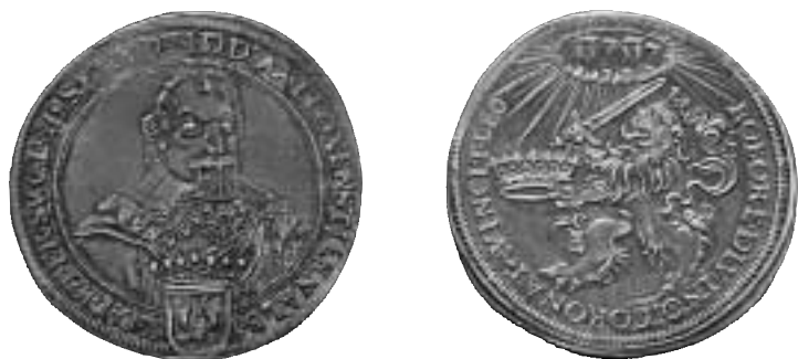
Fig. 3. Riksdaler u. år med Axel Oxenstiernas porträtt, troligen präglad i Würzburg 1633/34. SB s. 195 nr 15.

ering synes ha vunnit allmän acceptans i den numismatiska litteraturen. 15