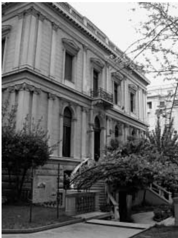
Numismatiska museets imponerande fasad.

Hittills har bara en begränsad del av samlingarna kunnat ställas ut i den