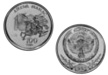
Guldmynt från Kirgisiska republiken. H M Konungens samling.