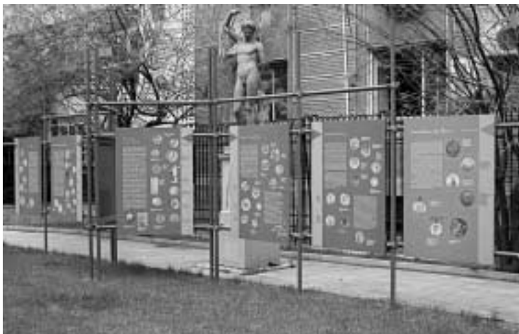
Numismatiska museets gård utnyttjas till olika skärmutställningar.