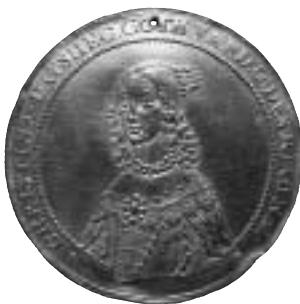
Kristina, Riga, 5-dukat 1645. Ett av de guldmynt som stals i Vancouver 1994 men kunde återbördas till ägaren elva år senare.

Dagen efter det första telefonsamtalet kom tre bildfiler med e-post. De innehöll fotografier av åtsidan på fem dukater från svenska besittningar med ungefärliga vikter och årtal angivna, fransidan på en av dukaterna samt inskriften på ett av mynten nedskrivna (men feltolkad) på ett papper. Nu förstärktes den tidigare aningen om att allt inte stod rätt till.