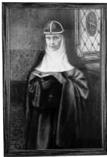
Fig. 2. Porträtt i olja av Elisabeth Hesselblad. Originalen finns Casa di Santa Brigida i Rom, kopia i Djursholm.