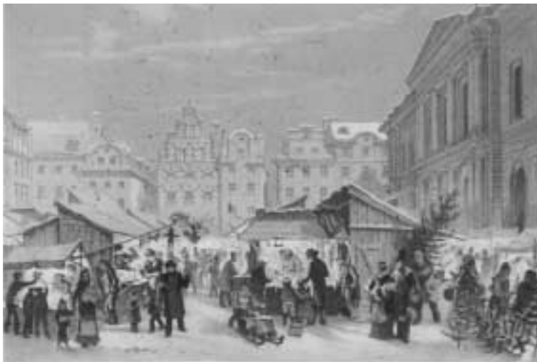
Julmarknad på Stortorget i Gamla Stan, Stockholm. Färglitografi av O. A. Mankell. 1870-tal.

Tjerneld, S.: Stockholmsliv. Hur vi bott, arbetat och roat oss under 100 år . II. 1951.