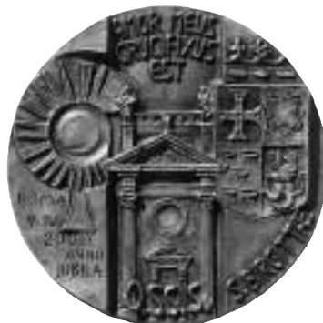
Fig. 1. Medaljongerna, utförda av Mauro Baldessari, över ingången till systrarnas gästhem i Djursholm.

Även andra kloster grundades bl.a. i Schweiz, England och Indien. På våren 1957 förbereddes det första klostret i USA. I Oregon i USA finns idag det enda klostret för munkar inom orden. Efter stora ansträngningar lyckades birgittinerna år 1931 också förvärva Casa di Santa Brigida vid Piazza Farnese i Rom, vilket idag är navet i ordens organisation.