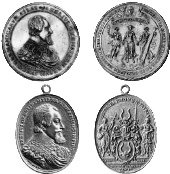
Fig. 1-2. Medaljer över Axel Oxenstierna daterade 1634 och signerade F. G. (= F. Guichart). Hyckert s. 22-23 nr 3-4.