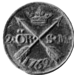
Pepparkaksmått på Cajsa Wargs tid. En dubbel slant – 2 öre sm präglad för Adolf Fredrik.