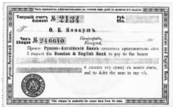
Checkprov från The Russian & English Bank, Petrograd ca 1916. Checken hade begränsad giltighetstid på en vecka fr.o.m. det utskrivna datumet.