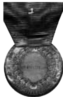
Belønningsmedaljen for Norsk Haandverk og Industri, med krone og bånd i 29 mm, sølv. Foto før.