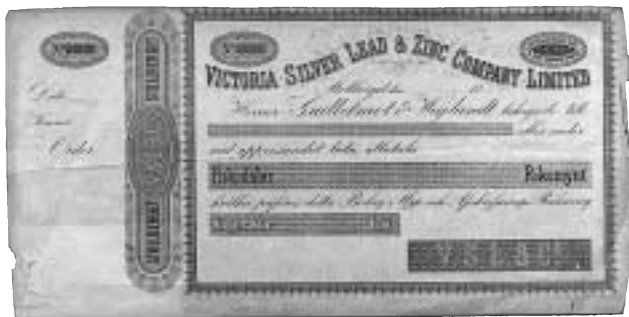
Checkprov från Victoria Silver Lead & Zinc Company Limited i Stollberget. Checken är tryckt under de år då Sverige hade riksdaler riksmünt som valuta, d.v.s. före 1873. Stollberget ligger vid Väster Silfberg i Stora Tuna sn, Dalarna.