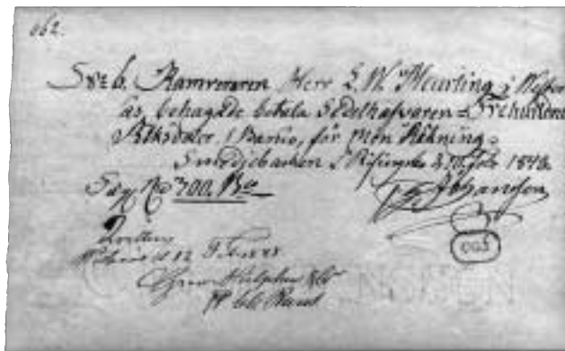
Handskriven check på 300 riksdaler banko, utfärdad i Smedjebacken / Risingsbo den 10 februari 1848.