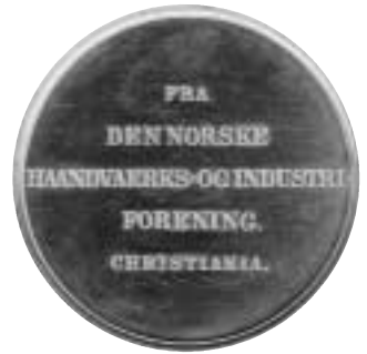
Den Norske Haandvaerks- og Industriforening i Christiania, belønningsmedalje med Carl XV's monogram preget i 1871. Foto før.