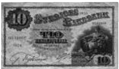
Sveriges Riksbank. Sedel om 10 kronor utgiven 1908.