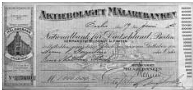
Check från Aktiebolaget Mälarebanken, gällande i Tyskland och med konto hos Nationalbank für Deutschland, Berlin, 1.000.000 mark, 19 juni 1923. Summan kan verka mycket stor, men årtalet 1923 skvallrar om att checken utskrevs när Tyskland befann sig mitt i den värsta inflationsperioden. □