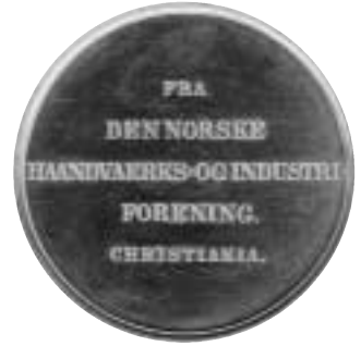
Den Norske Haandvaerks- og Industriforening i Christianias belønningsmedalje med Oscar IIs monogram preget 1 stk. i 1879 og 1 stk. i 1880 i gull 992/1000 med 12 dukaters verdi (41,6 g). Foto før.