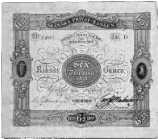
Skånska Privat-Banken. Sedel om 6 riksdaler 32 skilling banko utgiven 1841.