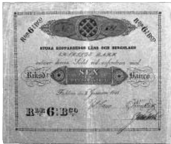
Stora Kopparbergs Läns och Bergslags Enskilda Bank. Sedel om 6 riksdaler 32 skilling banko utgiven 1841.