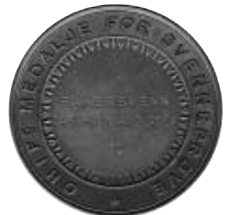
Oslo Håndverks- og Industriforenings medalje for svenneprøve, 40 mm, bronse. Foto før.