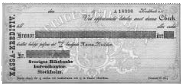
Checkprov från Sveriges Riksbanks huvudkontor i Stockholm, Kassakreditiv, ca 1900.