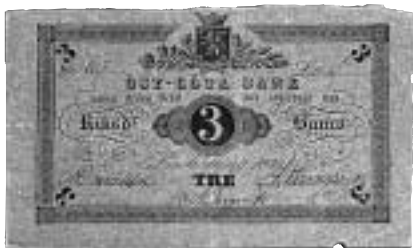
Öst-Göta Bank. Sedel om tre riksdaler banko utgiven 1839.