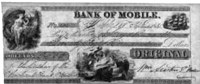
Check från Bank of Mobile och utfärdad i Mobile, Alabama, den 18 september 1835. Summan är på $2.500.