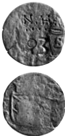
Fig. 1. Ett exempel på att Kristinas ¼-ören cirkulerade länge; här har ett sådant återanvänts såsom pollett vid kolleleverans till Hedvigfors järnverk under 1840/50-talen; N. H. = smeden Nordholm. Jfr NM IV s. 18 nr 7.

Tidström besåg också en raritet som bevarades av Sätters kyrka, nämligen ett 8 dalers plåtmynt. Han konstaterade att det vägde lika mycket som sex stycken "sexdalers" (= 2 dalers sm) plåtar av dåtidens fabrikat. Vad som senare blivit av exemplaret ifråga är höljt i dunkel. 3