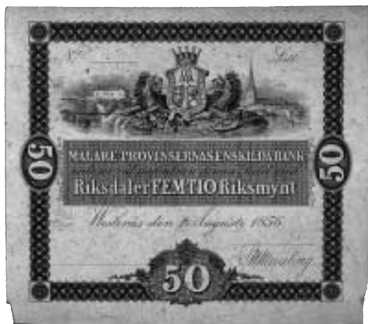
Mälare-Propinseernas Enskilda Bank. Sedel om 50 riksdaler riksmünt utgiven 1856.

riksdagen. Samtidigt fanns det en rädsla för ett kvantitativt underskott på betalningsmedel, och det rörelsekapital som de enskilda bankerna kunde tillhandahålla spelade lokalt en betydelsefull roll. Tidvis utgjorde privatbankernas sedlar 60% av den totala sedelstocken, vilket inte var en oväsentlig del av sedelcirkulationen i landet. I en kunglig kungörelse 1846 likställdes privatbankers sedlar med de statliga ur förfalskningssynpunkt. Vid 1853-1854 års riksdag fick frågan sin slutliga lösning och privatbanksedlarna blev accepterade men samtidigt aldrig erkända. Exempelvis krävde riksdagen att skatten skulle betalas i riksbanksedlar.