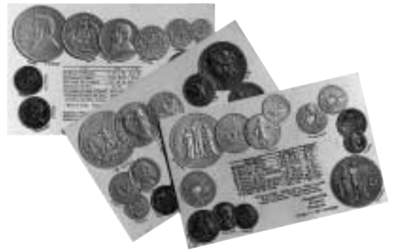
4. Boken Die Münzen der wichtigsten Länder som utgavs i Wien vid slutet av 1920-talet samt ett antal vykort från samma bok.