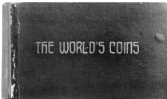
2. Boken The World's Coins som trycktes i Tyskland ca 1910 samt en uppslagen sida i samma bok.