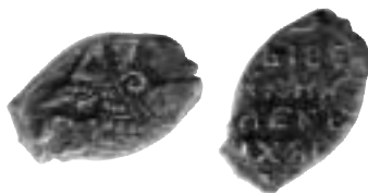
Aleksej Michailovitch, Moskva 1655-1663, 0,51 g, M#4d. Kopek slagen i koppar.