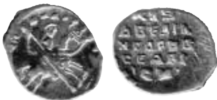
Ivan IV Vasiljevich, Novgorod 1535-1538, 0,67 g, K/G#75, M#1:9-12.