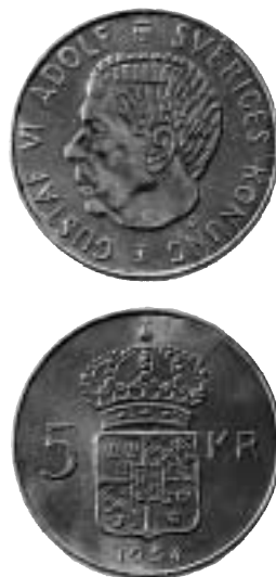
Femkronorsmyntet av år 1954 präglat för Gustav VI Adolf. Silverhalten är 400/1000.

morna i genomsnitt höll i ett halvår. De blev slitna allt snabbare, eftersom folk bar mer och mer kontanter på sig – och femkronorssedeln hade alltef-