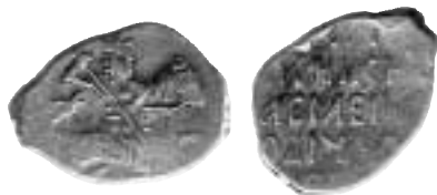
Svenska ockupationen av Novgorod, 1615-1617, 0,48 g, K/G#327, M#6:2-2. Den typ som har präglats med den falske Dimitrijs åtsida och Vasilij Sjujskijts frånsida.