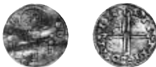
Dansk penning präglad i Lund under Sven Estridsen (1047-1074/76).

Generellt har stor vikt lagts vid att redovisa fyndomständigheterna vid de olika fynden. Detta levandegör fynden och gör texten spännande. En del fynd är enorma, som t.ex. den s.k. Lohe-skatten i Gamla stan, vilken påträffades år 1937 och som innehåller omkring 18 000 mynt präglade mellan åren 1619 och 1741. Delar av Lohe-skatten är numera utställd i Kungl. Myntkabinettets permanenta utställningar. Andra fynd är betydligt beskedligare, såsom det ensamfunna vikingatida myntet som påträffades i närheten av Hedvig Eleonora kyrka på Öster-