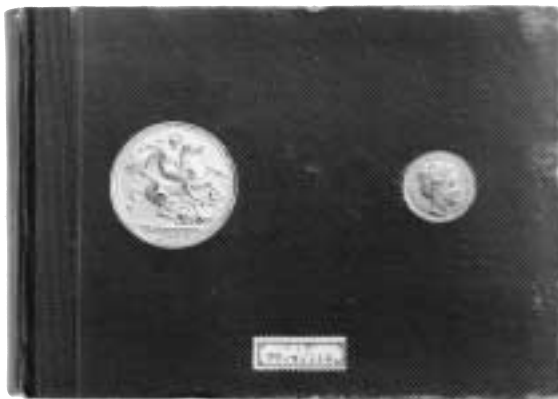
1. Bok utgiven av Max Heimbrecht, Berlin, vid slutet av 1920-talet samt en uppslagen sida i samma bok.

Det fanns emellertid en fördel med myntet som en journalist i Stockholms-Tidningen den 12 november 1960 kunde konstatera: Men tänk bara, svenska folket, som inte är alltför sparsamt av sig, har så där en 22 miljoner kronor i silverfemmor i sina sparbössor! Eller byråldåror. IW