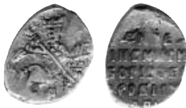
Boris Fjodorovitch Godunov, Novgorod 1600, 0,65 g, K/G#209, M#3:2-2.