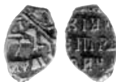
Peter Aleksejevitch, Moskva 1711, 0,27 g, K/G#11:5-18. Observera bokstävernas utformning i ”europaiserad” stil.