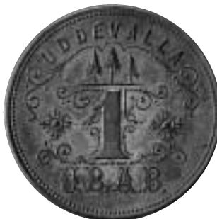
Pollett från Uddevalla.