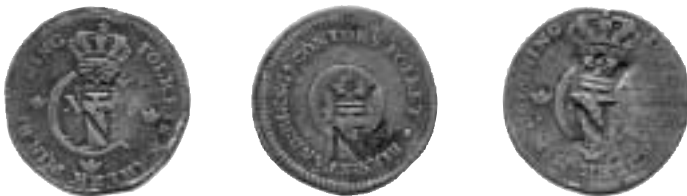
1. Med krönt N kontramarkerade ½-skillingar 1827 och 1802 samt en ¼ skilling 1829, vilka användes som polletter i Jäders bruk.