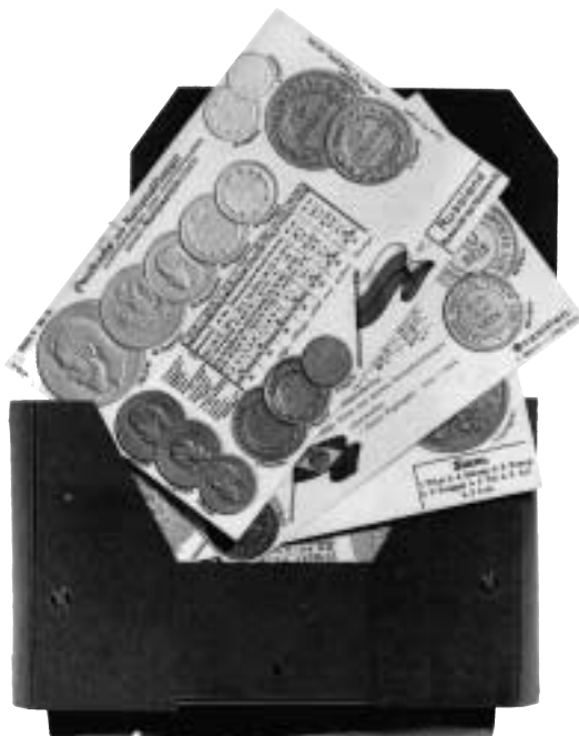
3. Innehållet i det fodral av papp som firman Bröderna Bergman, Stockholm, sålde ca 1910