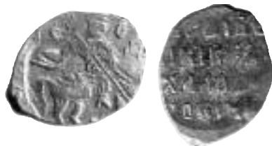
Folkliga upproret, Moskva 1613, 0,49 g, K/G#320, M#5:2-2. Observera felstavningen av tsarnamnet: ”[MI]CHALO” i stället för ”[MI]CHAILLO”.