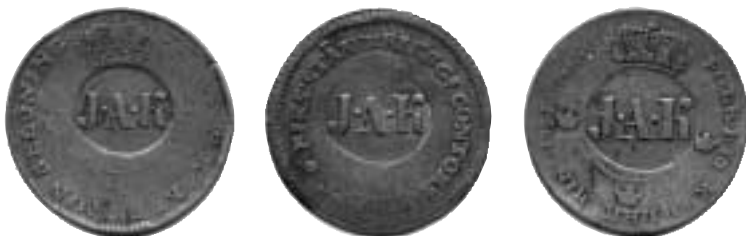
2. Med J. A. K. kontramarkerade ½-skillingar 1822 (= ¾ dagsverke), 1820 (= ½ dagsverke) samt ¼ skilling 1825 (= ¼ dagsverke), vilka användes som polletter på Storebergs gods.

Enligt NM XII:133:3-5 är ½ skilling = ¾ dagsverke, ½ skilling riksgälds = ½ dagsverke och ¼ skilling = ¼ dagsverke. (Bild 2.)