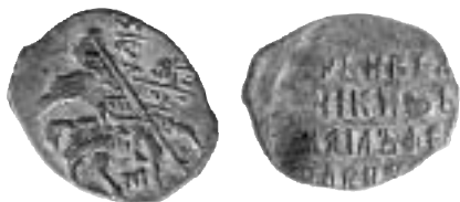
Michail Fjodorovitch, Moskva 1619, 0,45 g, K/G#406, M#8:9-13.