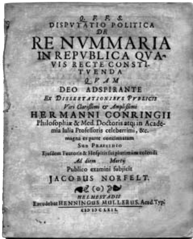
Fig. 1. Titelbladet till Jakob Norfelts numismatiska avhandling tryckt i Helmstedt, Tyskland, år 1662. Exemplar i privat ägo. Dekesel 2002, s. 1952, N 105 (Cat. 2), Issue II.

I Elgenstiernas verk finns det en Jakob Bohm, adlad Norfelt, född 1640 i Jönköping; adlad jämte sin styvfader (Israel Johannis Noræus, adlad Norfelt) den 5 augusti 1653. Vidare står det att Norfelt blev student i Uppsala i september 1654, i Rostock i oktober 1657 samt att han reste utrikes år 1662 och "utgav i Helmstedt en vacker och lärd disputation". Jakob Norfelt dog ogift den 13 december år 1667 och han är begravd i Gustavi domkyrka i Göte-