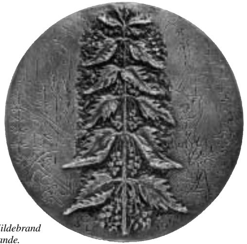
1. Foto: Gabriel Hildebrand liksom följande.