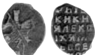
Aleksej Michailovitch, Moskva 1663-1676, 0,48 g, M#12:29-40.