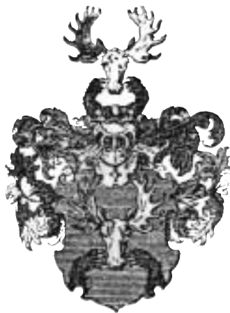
Fig. 2. Adliga ätten Norfelts vapen. Ur: Elgenstierna 1930, s. 511.

borg. Adliga ätten Norfelt (introducerad 1654 under nr 594) dog ut 1677 genom styvfadern Israel Norfelts bortgång. 4 (Fig. 2.)