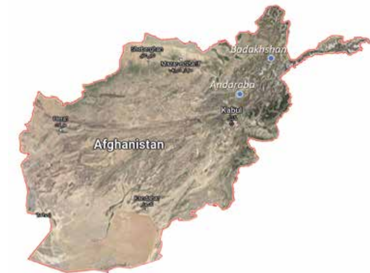
Kartan indikerar de ungefärliga platserna, där de två myntorterna Badakhshan och Andaraba kan ha varit belägna.