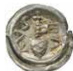
5. Fynd från Gränna 1987. Inskrift: ARVS. Vikt 0,23 g. Diameter 18 mm.