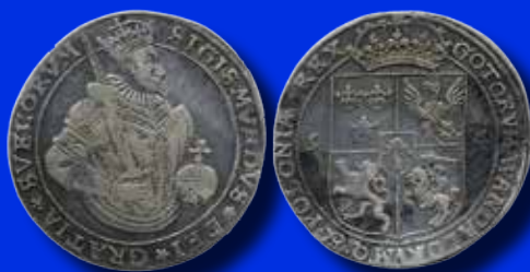
Sigismund 1 daler 1594