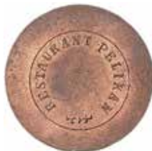
Två polletter av mässing och koppar i valörerna 500 öre respektive 6 öre från tidigast 1885 tillhörande Restaurant Pelikan.

Till Pelikan drog Bellman och hans vänner vid mitten av 1760-talet. Åtminstone nämner han den i en av sina ungdomsdikter: