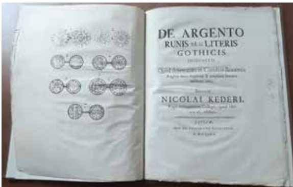
3. Titeluppslag till Nils Keder: De Argento Runis . Leipzig 1703. Se verksförteckning nr 4 i Holmia Literata 1707.

14. Emblem, inskrifter och symboler [ emblemata, in Scriptiones & Symbola ] uppfunna av honom själv till skilda offentliga högtider eller fästade vid medaljer, särskilt dem till minne av Sveriges Högädla Konungar av den Gustavianska ätten, som gjorts av den mycket skickliga myntmästaren [ monetarius ] Arwid Karlsteen