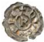
4. Fynd från Skänninge 1961. Omskrift: NVCOPIE. Vikt 0,32 g. Diameter 19 mm.