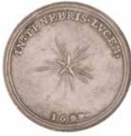
4. Medalj i silver över Nils Keder av Arvid Karlsteen 1697. Hd nr 2 s. 114. Diameter 35 mm. Se sista stycket efter verksförteckningen i Holmia Literata 1707.

och som inte tidigare förtecknats. Dessa alla skall någon gång förevisas tillsammans i offentligheten, samlade i en volym. Se Nova literaria Lubecensia år 1700 s. 203 & år 1701 s. 272.