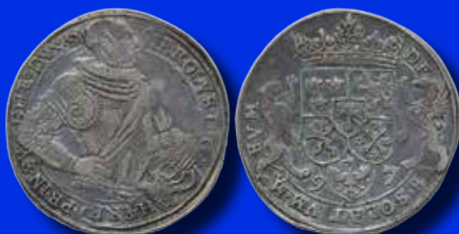
Karl, hertig av Södermanland 1 daler 1597