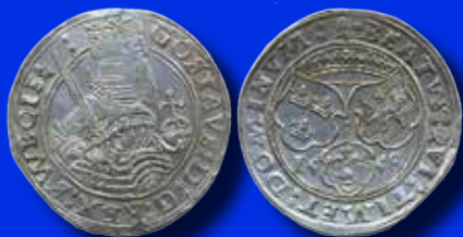
Gustav Vasa 1 mark 1558 Åbo