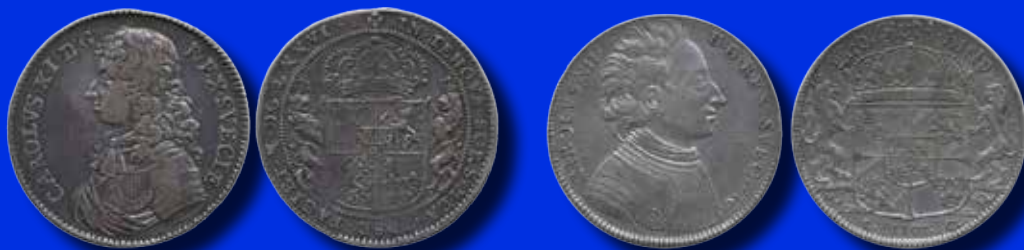
Karl XI 1 riksdaler 1676

Superbt välpräglad exemplar med skimrande regnbågslika fält