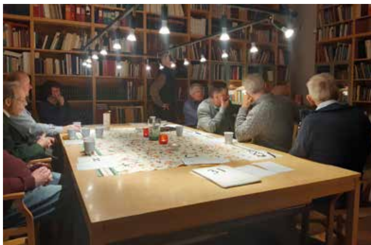
4. Några av deltagarna i SNF:s julaktiviteter 2021.