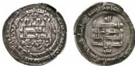
Mulan, präglad med stamper från Badakhshan och Andaraba.

I vilket fall som helst kom det ovanliga myntet att färdas den långa och strapatsrika vägen från nordöstra Afghanistan, genom många handelsmäns händer och via vikingars handelsvägar för att till sist hamna i den kruka som grävdes ner på Gotland. Som jag skrev i den förra artikeln så innehöll fyndet, förutom silver i form av armbyglar och smyckesfragment, 518 mynt 4 varav 237 var arabiska.