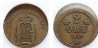
Oscar II, 2 öre 1895. Cirka 12 procents snedprägling.