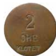
Kopparpollett tillhörande Café Klotet, 1880-tal.