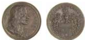
1. Nils Keder. Åtsidan av Arvid Karlsteen 1687. Frånsidan av C. G. Hartman 1711. Hd nr 3 s. 114. Silver. Diameter 18 mm.

Ävenså två Kommentarer: den ena över gamla engelska mynt, 2 den andra över ryskt myntväsen 3 som hittills nästan inte behandlats av andra eller publicerats. Nu strävar han – för så vitt det är möjligt för honom, då han är svårt drabbad av dålig hälsa (vilket vi med största rätt sörjer i fråga om denne lysande man) – att fullborda en traktat vars titel han skall ange till: Ett tvåspråkigt mynt av yppersta sällsynthet [ Eximie raritatis nummus bilinguis ] ty det är försett på ena sidan med latinska bokstäver, på andra med gotiska eller runor [ Ramis ], samt åtskilliga andra mynt från olika folk, som inte tidigare på detta sätt grävts upp tillsammans ur den östgötska jorden, men som nu [publiceras] försedda med kortfattad kommentar och illustrerade och prydda med överallt insatta (bilder av) andra mynt. 4