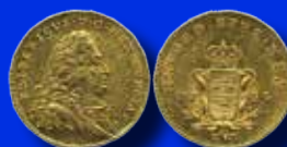
Fredrik I 1 dukat 1744