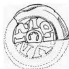
2b. Rekonstruktion baserad på myntet Bild 2a. Tolkad omskrift: SICTVN. Tecknad av Bengt Händel.