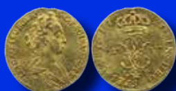
Ulrika Eleonora 1 dukat 1720