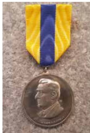
3. Sven Svensson-medaljen utfördes av konstnären Ernst Nordin.

Efter auktionen och utlämnande av auktionsobjekt bjöds på smörgåstårter och dryck, många livliga numismatiska diskussioner fördes i föreningens bibliotek/samlingssal. Julaktiviteten är populär. Förutom auktion och förtäring är det naturligtvis möjligheten att träffa andra numismatiskt intresserade som lockar. Umgänge som vi inte varit bortskämda med på senare tid. Pandemin har satt stopp för många föreningsaktiviteter under 2020–2021 vi får nu hoppas att 2022 blir ett mer normalt år med många föreningsaktiviteter både i Stockholm och runt om i landet.