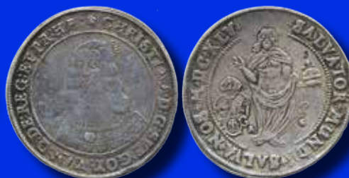
Kristina 2 riksdaler 1645