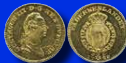
Gustav III 1 dukat 1789/7

Vi erbjuder live-online budgivning under auktionen!