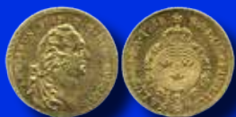
Adolf Fredrik 1 dukat 1758