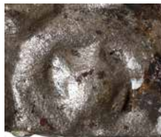
2c. Förstoring av mittmotivet på myntet Bild 2a.

der Erik Eriksson som regerade cirka 1222–1229 och 1234–1250 eller Knut Holmgersons länge som var regent däremellan, 1229–1234. Alltså från 1220- till 1240-talen.