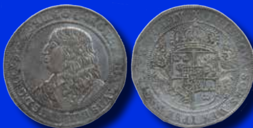
Karl X Gustav 1 riksdaler 1654

Några redan inlämnade objekt till maj-auktionen: