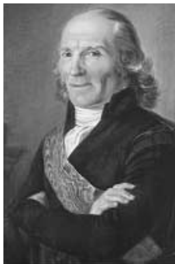
Carl Peter Thunberg (1743-1828).