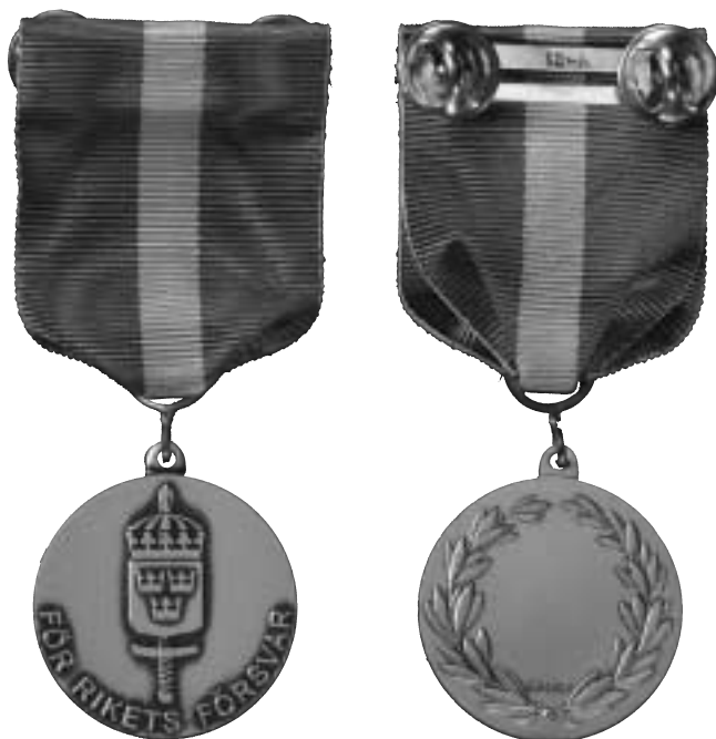
Den nyinstiftade värnpliktsmedaljen.

Den intresserade kan vända sig till AB Sporrang, Nytorpsvägen 12, Box 1701, 183 17 Täby. Telefon: 08-446 54 50. AB Sporrang säljer presentetu med medalj, miniatyr och släpspanne för 342:50 kr + moms och frakt. Vid samtidig beställning av minst tio presentetuiter blir kostnaden per etui 269:50 kr + moms