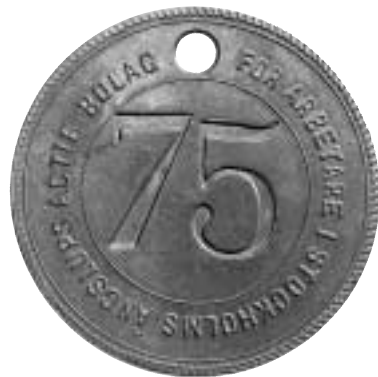
5. Mässingspollett för arbetare i Stockholms ångslups AB / 75.

letter vid Sala silvergruva. Dædalus. Tekniska museets årsbok 1955.