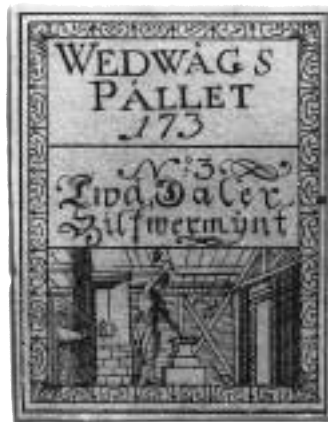
2. Papperspollett från Wedevågs järnverk, 2 daler sm, 1700-talet.

pollettskåp. De svenska polletterna var utlagda i landskaps- och alfabetisk ordning. Här och var bland alla metallpolletterna fanns även ett fåtal papperspolletter insorterade, men merparten av dessa låg i kapslar tillsammans med sedlarna i ett annat skåp. Helt för sig låg den f.d. Bankmuseets pollettsamling som endast bestod av drygt etthundra exemplar. Efter de svenska polletterna kom de utländska som fortfarande var osorterade. De två skåpen innehöll också museets samling av myntvikter, frimärksmynt, falska mynt, mynt i dekorativ användning samt leksakspengar. I samma skåp som de brittiska mynten fanns de engelska polletterna (tokens) från 1600- och 1700-talen. Riksbankens pollettsamling fanns i samma skåp som deras svenska mynt. Den ende som sysslade med polletterna var museets mångkunnige Jüri Tamsalu. Han var också skicklig på att få fram snygga polaroidbilder vid behov.