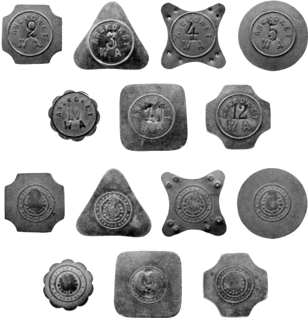
2a-b. Kopparpolletter med valörerna 2, 3, 4, 5 samt 10 och 12 av mässing med inskriften ÅNGKÖKET W. A. [Wiktor Aronsson]. På frånsidorna ses Sporrongs stämpel.