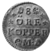
1. Kopparpollett från Leijonanciers klädesväveri i Stockholm, 8 öre. Stiernstedt nr 6 s. 142.