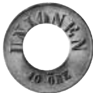
Ångslupsbolaget "Unionen" startade 1864 med två ångslupar på sträckan Ladugårdslandet – Staden.

År 1867 uppgick det i "Stockholms Ångslupsaktiebolag". Denna pollett av mässing gällde för 10 öre.