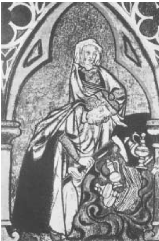
En man gräver fram en skatt. Illustration till legenden om mannen som sålde sin hustru till djävulen för anvisningen på en dold skatt. Detalj från Dale kyrka i Norge. 1200-talets senare hälft. Repro av G. Hildebrand ur Bengt Thordemans Dolda skatters hemligheter , 1941.

Redogörelsen av skatten i Egils saga visar att det finns tre olika faser när det gäller skattbeskrivningen: 1. skattförvärv, 2. skattförvaring liksom -tillökning och 3. skattgömmande respektive -förlust. Enligt dessa faser ämnar jag diskutera de andra sagornas skattmotiv. Skattmotiven har därvidlag bestämts med hjälp av de stickord som Egils saga ger. En allmän benämning för pengar är då fé , lausafé står för lösegendom, och dyrgripar kallas för gripr . Penningmått är mörk och penningr , ädelmetallen betecknas med gull och silfr . Det blotta penningbegreppet måste dock utvidgas med ett måttuttryck som visar på en stor mängd för att kunna bli ett skattord. Dagens ”mycket” hette på fornisländska mikit , en otrolig mängd betecknades som ógryn-ni . Skatterna förvarades enligt Egils