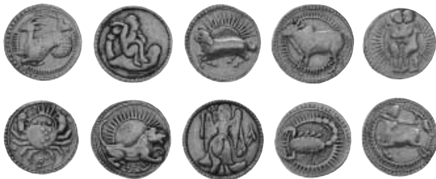
Zodiak-rupier i guld ur Kungl. Myntkabinettets samling. Se också omslagsbilden i färg.