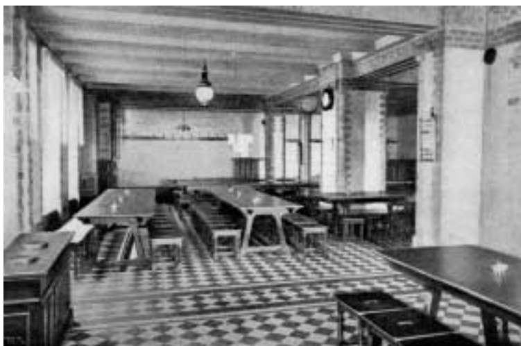
1. Ångköket, d.v.s. utskänkingsstället vid Skeppsbron i Göteborg.