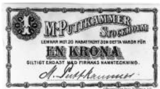
8. Rabattpollett av papp från M. Puttkammer i Stockholm. Tjugo polletter motsvarade en kronas värde.

ket intressant "Fartygslista" som omfattar alla Mälarens tidigaste ångfartyg i kronologisk ordning.