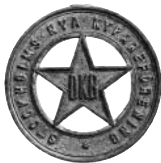
7. Mässingspollett med femuddig stjärna från Stockholms Nya Kypareförening / DKB.