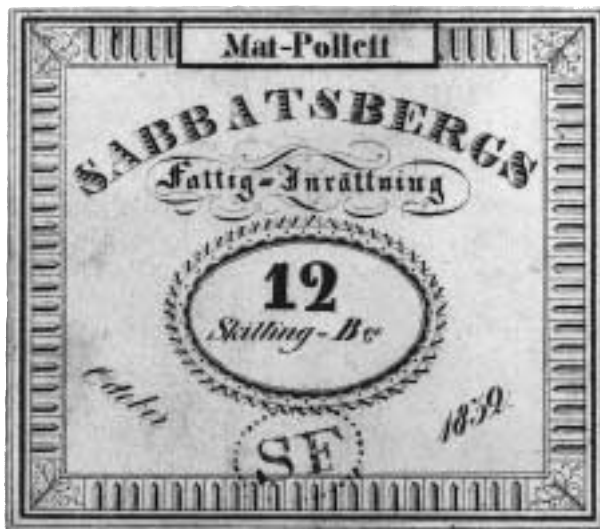
6. Matpollett av papp från Sabbatsbergs Fattiginrättning i Stockholm, 12 skilling banko, 1832.

Ovanstående lista ger den intresserade olika ingångar till det mycket omfattande pollettmaterialet, men det finns emellertid många fler artiklar i Svensk Numismatisk Tidskrift (leta i SNT:s register), Skandinavisk Numismatik , Mynttidningen och i Nordisk Numismatisk Unions Medlemsblad .