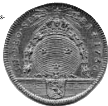
Fredrik I. Dukat 1750. Ex. Carl Snoilsky (nummer 1486). Nu i Antellska samlingen på Nationalmuseet i Helsingfors.