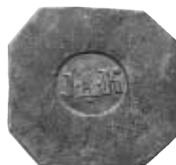
Tre polletter från lantgodset Storeberg.