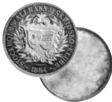
1. Prisedalj från Stockholms Allmänna Skridskoklubb. Graverad av Adolf Lindberg 1884. Ensidig.