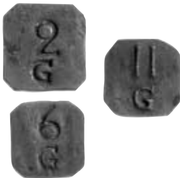
Tre kollevaranspolletter för Gimo Bruk.

Till de tidigare beskrivna Gimopolletterna i SNT 2001:8, s. 196-197, kommer de här avbildade från Risinge gård, som Norrtälje Mynthandel inköpte och sedan sålde till Kungl. Myntkabinettet.