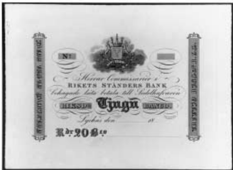
Provtryck av assignation från Lyckås.

derna Malcolm och Hugo Hamilton uppföra en ny herrgård vid Huseby, ca 20 km sydväst om Växjö. Den ersatte en enkel träbyggnad från 1780, som tillkommit i en hast sedan den stora herrgårdsbyggnaden från 1690 hade brunnit. Huseby bruk var ett av Smålands äldsta och största järnbruk. Bröderna Malcolm och Hugo Hamilton hade moderniserat sin industriella verksamhet som innebar ett uppsving för Huseby.