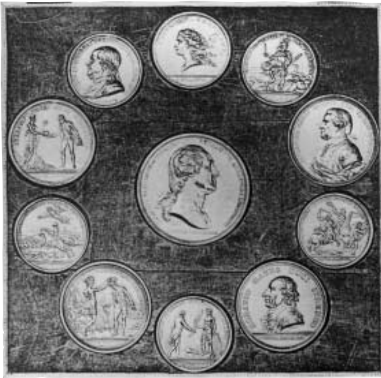
4. Minnesmedaljer över amerikanska framgångar under självständighetskriget mot Storbritannien. Dessa medaljer, som ligger på en specialgjord platta, överlämnades till president George Washington.