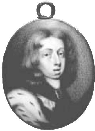
2. Konung Karl XI (f. 1655, 1660-97). Konstnär: Pierre Signac (1623-84). Emalj. Oval. Ram av metall. Mått: h. 3,1 cm. NMB 2226.