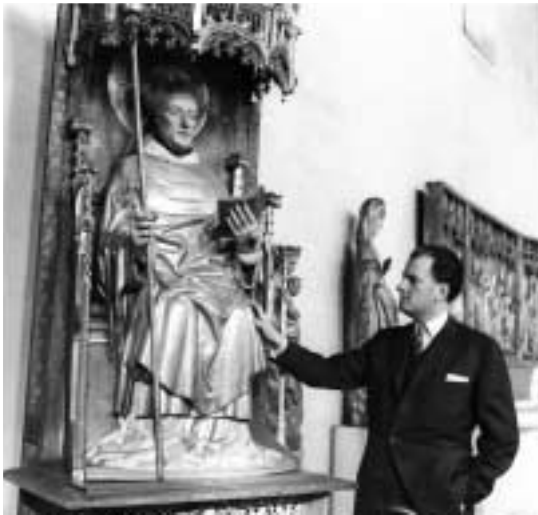
I Historiska museets utställning 1965.