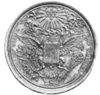
5. Den s.k. Diplomatic Medal som användes som gåva till hemvändande utländska sändebud.

Augustin Dupré. Själva präglingen av de amerikanska medaljerna skedde i den kungliga inrättningen Monnaie des Médailles som då fanns i Grande Galerie du Louvre. Medaljpräglingen flyttades över till andra sidan Seine år 1806. Då slogs mynt- och medaljframställningen ihop i byggnaden Hôtel des Monnaies .