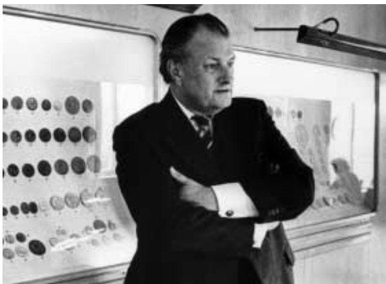
I Medaljsalen i Kungl. Myntkabinettet på Storgatan 41.