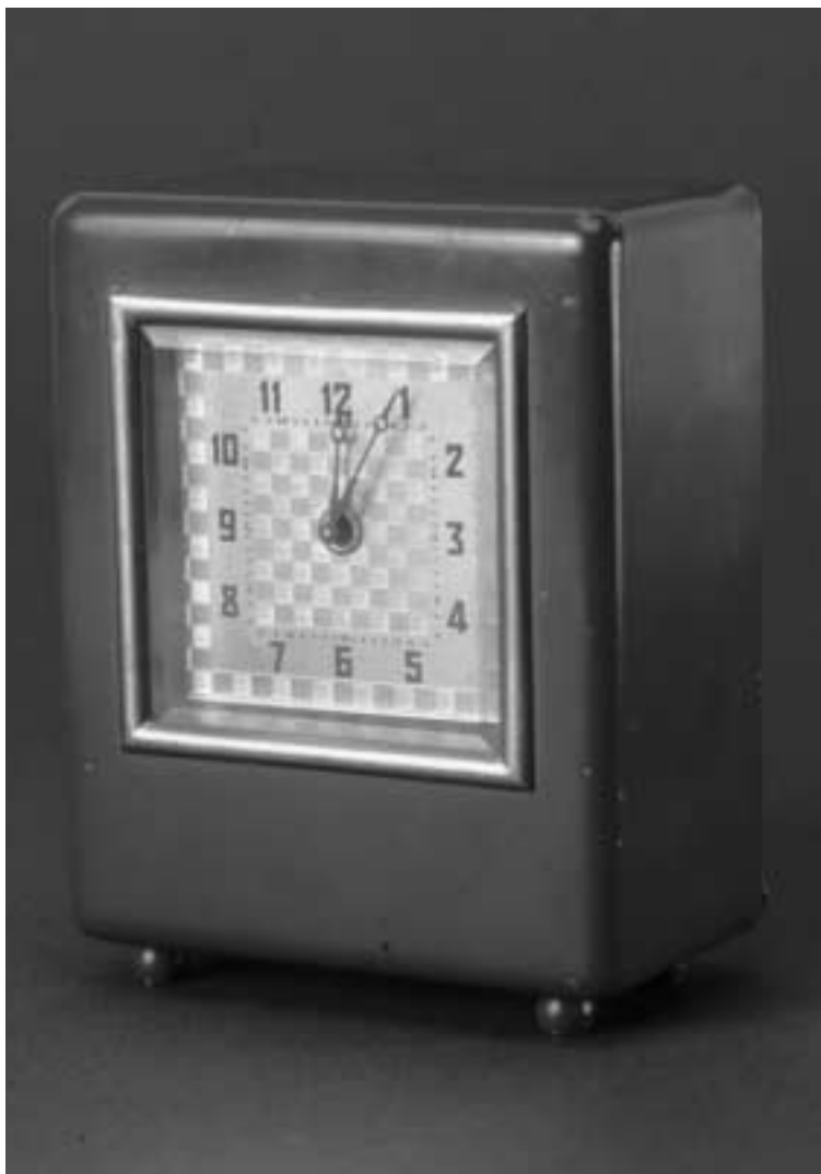
Fig. 4. Klocksparbössa märkt med "Gefle Stads Sparbank" på baksydet. Bössan har ett hölje av blå metall, medan urramen och baksydet är av gul mässing. Den har också små runda kulor som "fötter".

Måndagen den 19 februari 1962 öppnades en tillfällig utställning i det som då var Gävleborgs Sparbank i dess huvudkontor på Nygatan 26. Banken visade i huvudsak sin egen samling med mynt från Gustav Vasas tid och framåt – "Svenska mynt under 400 år". Den från TV då kände 10.000-kronorsvinnaren Bertel Ting-