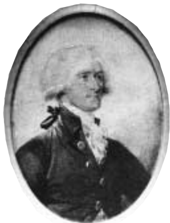
1. Thomas Jefferson. Miniatyr målning utförd av John Trumbull.

På floden Seines vänstra strand i Paris ligger Hôtel des Monnaies. Huset ritades av Jacques-Denis Antoine. Det byggdes mellan åren 1768-1775. Den amerikanske politikern Thomas Jefferson (1743-1826) besökte huset många gånger när han var Förenta Staternas representant i den franska huvudstaden. Han var där dels för att studera myntningen, men också för att besöka markisen de Condorcets hem. Condorcet var en politisk reformator, matematiker och sekreterare i franska Vetenskapsakademien. Dessutom var han Inspecteur général des monnaies , därav bostaden i myntverket.