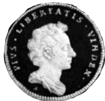
6. Konung Karl XII (f. 1682, 1697-1718). Konstnär: Christopher Conrad Hunger (verksam 1717-48). Emalj. Mått: diam. 2,6 cm. NMB 2225.