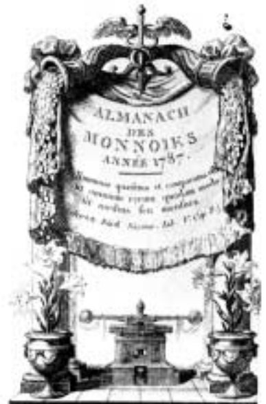
6. Almanacka utgiven av det franska myntverket 1787. Detta exemplar har ägts av Jefferson. □