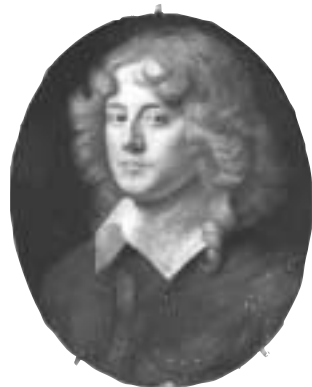
1. Riksdrotsen och greven Magnus Gabriel de la Gardie (1622-86). Konstnär: Alexander Cooper (1605-60). Akvarell/gouache på spelkort. Oval. Ram av metall. Mått: h. 5,8 cm. NMB 2235.