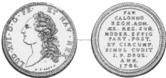
3. Provmynt, det s.k. Écu de Calonne från 1786/87.

Den mest omtalade Parismedaljen som gjordes för Förenta Staterna var den s.k. Diplomatic Medal . Den skulle användas som gåva till hemvändande utländska sändebud. Den präglades 1790 och graveringen hade utförts av