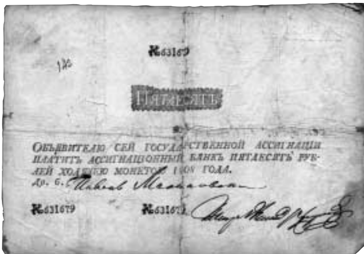
En s.k. napoleonförfalskning, 50 rubel 1808. KMK inv.nr 23 290.