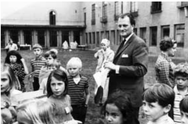
På museigården vid Historiska museets barndag den 13 september 1969.