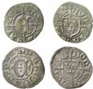
12–13. Så kallade interregnum-örtugar utgivna 1465–1467, troligen av riksföreståndaren och ärkebiskopen Jöns Bengtsson.

Sedan lång tid tillbaka har ett par mycket sällsynta örtugstyper, utgivna i Erik den heliges namn (SANTVS ERICVS), förts till denna interregnum-period. Vi talar om typerna LL 1 och 2a–b. Nyare stampstudier av