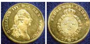
4. Gustav III, dukat 1774. Ex Ekström, Ahlström auktion 8, 1975, Schmitz 1990 och Antikören auktion 11, 1992.

År 1774 slogs totalt 7651 dukater, varav 824 var av guld från Ädelfors i Småland. Av de reguljära dukaterna präglades således inte mindre än 2473 stycken, eller 36,2%, av guld