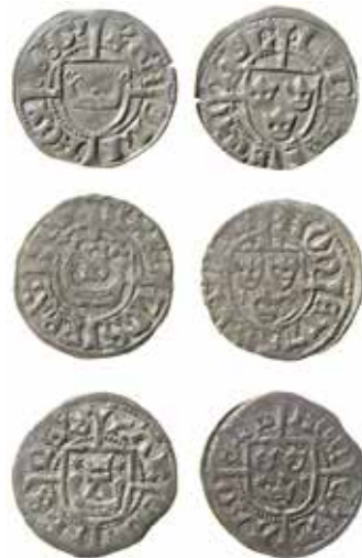
6–8. Karl Knutsson Bondes örtugar från Stockholm, Söderköping och Åbo introducerade 1453.

Jag har som hypotes tidigare pekat på möjligheten att Karl kanske flyttade myntverket från Åbo till Raseborg (där han själv befann sig) hösten 1465 och att detta är skälet till att de yngre Åbo-örtugarna har stjärnor i åt- och fransidans vapensköldar. "Raseborgsmynten" – om sådana finns – skulle alltså kunna identifieras som de "Åbo-mynt" som har två stjärnor i vapensköldarna på båda sidor. Jag vill betona att detta till vidare bör betraktas som en obevisad hypotes eller spekulation från min sida. Att myntning