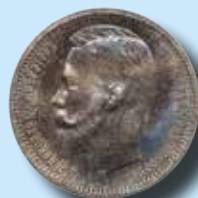
Ryssland. 1 rubel 1913 Proof 266.200:-