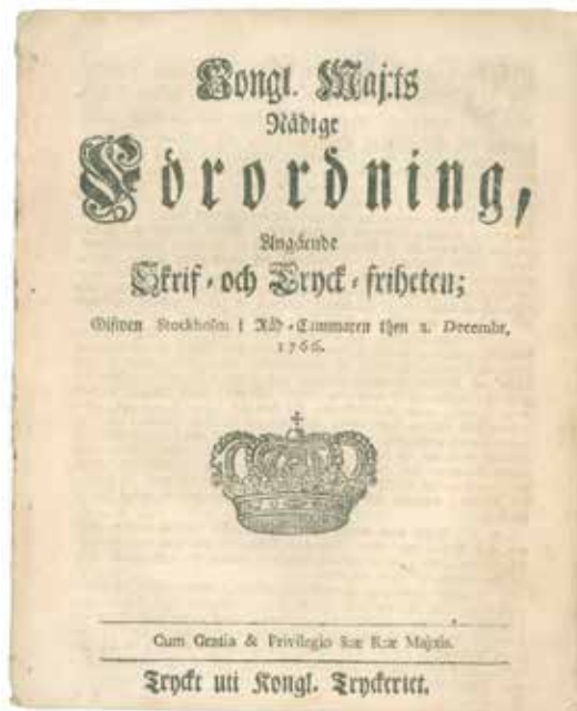
Tryckförordningen den 2 december 1766.

En särskild attraktion utgjorde visningen av ett superbt exemplar av världens första Tryckfrihetsförordning, publicerad 2 december 1766. För nyfikna fanns möjlighet att lyssna på mer information om detta spännande tryck, som kom tio år före USA:s självständighetsförklaring. Måhända finns innehåll i detta vårt viktiga svenska initiativ som kan ha inspirerat rörelsen som etablerade grundvalarna för Amerikas förenta stater. Detta exemplar ställdes sedan