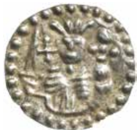
3. Den av Knut Erikssons svealandspenningar som mest påminner om det nyfunna myntet, fig. 1, men här med kors. Även detta är funnet i Skänningegraven. LL IA 5a.