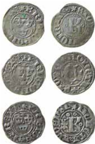
1–3. Kristoffer av Bayerns två typer av Stockholms-örtugar samt den sällsynta örtugen från Åbo.

Intressant bland Kristoffers örtugar är nog tveklöst den Åbo-örtug som till sin motivkomposition väl överensstämmer med Stockholms-typen med K (fig. 3). Dock har man bredvid central-K placerat ett litet krönt A (som symbol för Åbo) men av misstag punsat in detta upp och ner! Myntorten anges på frånsidan. Åbo-örtugen är ytterst sällsynt. Endast en åtsidestamp och en frånsidestamp har använts och till våra dagar har