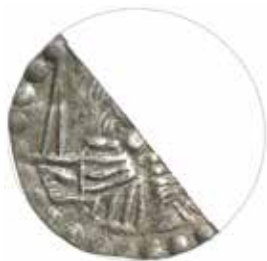
1–2. Tidigare okända penningar präglade för Knut Eriksson. Mynten påträffades i en Skänningegrav i Östergötland 2009.

1. Vikt 0,15 gram. 2. Vikt 0,21 gram, diameter 16 mm.