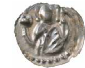
5. Kungen med riksäpplet i sin högra hand och fanan i vänster. LL IA 2b.

Exemplet ingår i Riksbankens samling, KMK.