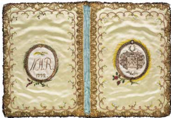
Märta Helena Reenstiernas sidenplånbok med hennes initialer och familjevapen, daterad 1792. Plånboken är inte nämnd i hennes dagbok som påbörjades först 1793.

FOTO: OLA MYRIN, KUNGL. MYNTKABINETTET. INV.NR 102536.