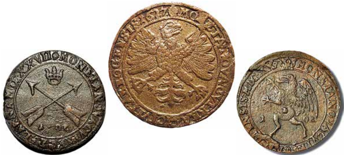
1. Frånsidor av Gustav II Adolfs ettöringar från Säter, Arboga och Nyköping. Förstorade.