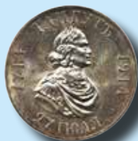
Ryssland 1 rubel 1914 121.000:-