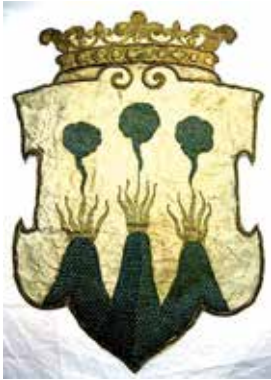
3. Västmanlands vapen som det såg ut under Gustav II Adolfs begravning 1634.

KÄLLA: HÄSTARNAS SCHABRAK UNDER BEGRAVNINGSPROCESSIONEN, LIVRUSTKAMMAREN.