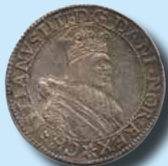
Norge. 1 speciedaler 1628 151.200:-