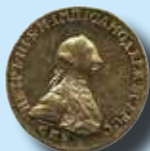
Ryssland 5 rubel 1762 460.000:-