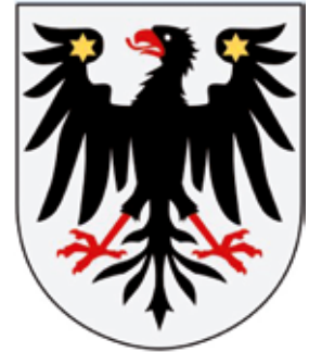
8. Arboga kommunvapen i dag.