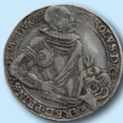
1 daler 1598 106.000:-