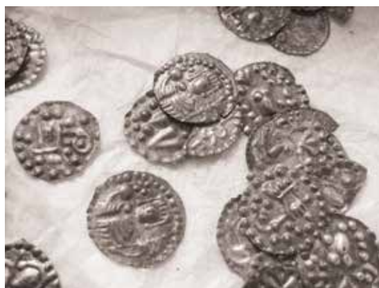
Skänningemynt efter konservering av Sophie Nyström.

Handen med dess stadiga grepp om svärdsfästet är så tydligt utformad att man ser alla fingrar och tummen.