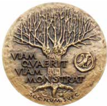
Nils Ludvig Rasmusson-medaljen. Konstnär: Gunvor Svensson Lundkvist. Diameter 55 mm.