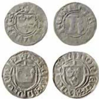
4–5. Karl Knutsson Bondes Stockholms-örtug slagen före 1453 samt prototypen ("provmyntet") till den örtugstyp som introducerades på tre olika myntorter år 1453.

titeln initialt formellt tillhörde Kettli Karlsson. Efter Kettils död i augusti 1465 blev Jöns även formellt riksföreståndare. Men redan efter drygt ett år (september 1466) förlorade han makten till Erik Axelsson Tott, som under tiden gradvis närmat sig Karl Knutsson. Karl återkallades hösten 1467 och han kunde i november 1467 återvända till Stockholm som kung över hela riket. Och som sådan avled han 1470.