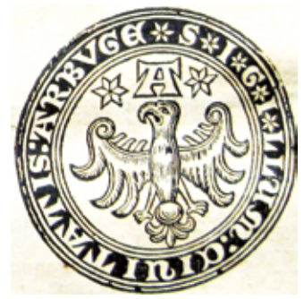
7. Arboga stads äldsta sigill enligt J. B. Lohman. Omskriften lyder: SIGILLUM CIUITATIS ARBVG vilket kan översättas med Arboga stads sigill.