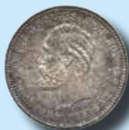
Norge. 2 kroner 1888 84.700:-