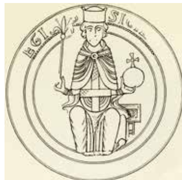
6. Det större av Knut Erikssons kända sigill. Han håller spiran i höger hand och riksäpplet i vänster.

Exemplet ingår i Riksbankens samling, KMK.