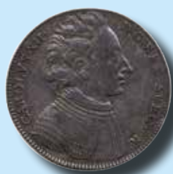
1 riksdaler 1707 49.000:-