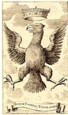
5. Värmlandsörnen enligt Erik Dahlberg (1625–1703).

KÄLLA: HÄSTARNAS SCHABRAK UNDER BEGRAVNINGSPROCESSIONEN, LIVRUSTKAMMAREN.