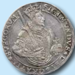
1 daler 1594 "SIGIMVNDVS" 677.000:-

Ett urval mynt (inkl. köparprovision) som vi har sålt tidigare: