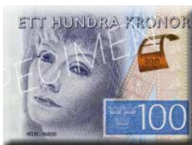
Porträtten av Birgit Nilsson på nyligen utgivna 500-kronorssedeln och av Greta Garbo på 100-kronorssedeln.