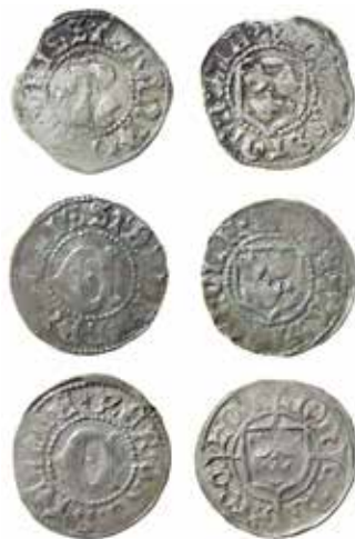
9–11. Kristian I:s tre huvudtyper av Stockholms-örtugar.

Utöver ovan nämnda problem kring tillgången på silver under åren före och efter 1470 är det enligt min åsikt rimligt att associera denna myntning med perioden 1465–1467, då kungen själv var närvarande i Finland. Att kungen – Karl behöll sin kungatitel även under exilen i Finland – under en längre tid residerade i Finland och inte i Sverige var ju även det en exceptionell situation. Att som alternativ i stället förlägga denna myntning till 1467–1470, då kungen lämnat Finland och återvänt till Stockholm, förefaller mig som