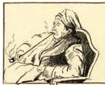
Carl Michael Bellman. Självporträtt 1794.

Skäl, kejsare, kungar och furstar Från länsman till högsta monark! Skäl, kypare! Gif du metvurstar Och bittert och spansk för sex mark Och smör och bröd, netto tre daler, En sup för tolf styfver ... med gråt ... Hin håle ger jag slika baler : Tolf öre blott kvar på min plåt!