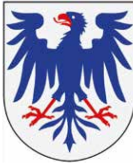
4. Värmlands landskapsvapen.