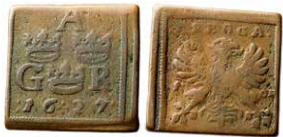
6. Arbogaklipping 1627, såld på MISAB 13 som objekt 688. Förstorad.

Vid mitten av 1800-talet skrotades skråväsendet i Sverige och sannolikt fick Arbogaörnen leva vidare som stadens symbol. Så sent som år 1969 fastställdes Arbogaörnen som Arbogas stadsvapen. Bilden, fig. 8 , visar Arboga kommunvapen. Det är inte mycket som skiljer den från Värmlandsörnen.