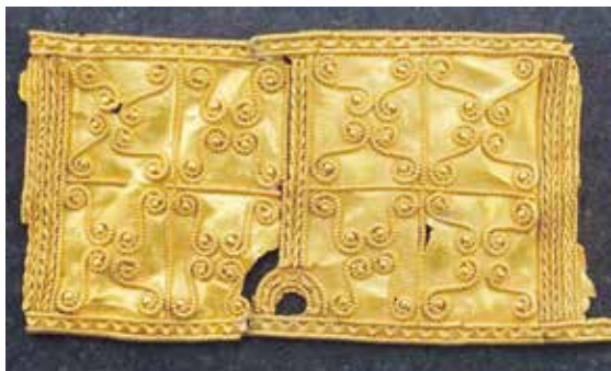
2-3. Beslag av guld i filigranteknik för svärdskaivle och svärdsblida. Ur fyndet från Tureholm. SHM/KMK inv.nr 28 och 29.