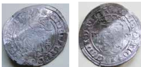
1-2. De to nye eksemplarer af G. 249 i Maglebyskatten fra Møn.