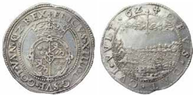
3. Nr 122. Erik XIV. Stockholm. 3 mark 1562.

Medeltidsavdelningen var riktigt bra och såväl rariteter som riktigt snygga exemplar såldes. Två små mynt var på förhand de mest uppmärksammade objekten. De båda penningarna från Sverker Karlsson (1196-1208) och Erik "läspe och halte" Eriksson (1222-1229, 1234-1250), båda XR- och i bra samlarkvalitet 1+/01, klubbades för 48 000 respektive 37 000 kr. Fig. 1-2.