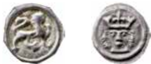
1-2. Penningar. Något förstorade. Nr 12. Sverker Karlsson (1196-1208). Nr 13. Erik Eriksson (1222---1250).