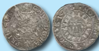
4 öre 1603 31.400:-