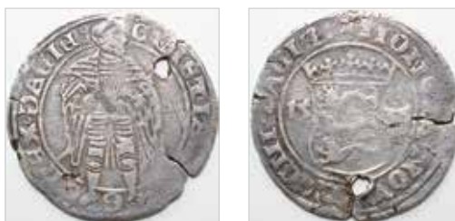
3. Det nyopdukkede eksemplar af G. 247.

pekter vedrørende Stockholmmønterne. Mens vi afventer skattens konservering med videre, skal der her præsenteres et nyt eksemplar af en Stockholm 8 skilling.