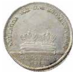
5. Nr 716. Karl XIII. Begravningskastpenning. 1/3 riksdaler 1818. Frånsida.

Flera mycket trevliga och välpräglade gotländska mynt fick höga bud. Men det gick även att fynda. En Interregnum-örtug om än i dåligt skick för 11 000 måste ses som förmånligt. Proveniensen är Bonde (Nordlind auktion 5:57) och slutpriset när myntet senast såldes var betydligt högre än denna gång.