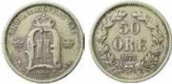
8. Nr 843. Samtida förfälskning av "Trollhätte-Svensson".