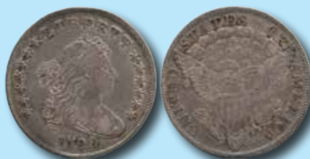
USA. 1 dollar 1799 15.100:-

Bättre mynt och hela samlingar mottages till vårens myntauktion.