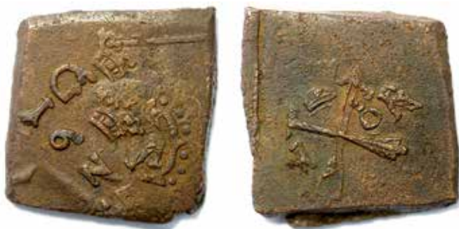
1. 1 öre 1625. Ref: Ottosson, typ 20.

Det är en sak som förbryllar. Tvåöringarna brukar vara större än ettöringarna, men här är ettöringen inte överdrivet stor. Men tittar vi närmare på kanten, ser vi att myntet faktiskt har klippts ned för att ge myntet rätt mått. Detta förklarar varför ramen