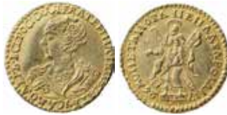
10. Nr 1159. Ryssland. Katarina I. 2 rubel 1726.

som skulle godkänna utformningen. Ledamöterna var dock missnöjda med kronornas placering. Tanken var att de båda kronorna skulle representera Sverige och Norge. Den högra kronan hade dock placerats över det nyligen (1809) förlorade Finland. Vitterhetsakademiens ledamöter föreslog i stället att kronorna skulle placeras på en kudde, vilket också blev fallet på de mynt som senare utdelades. Fig. 5. Historien förklarar troligen varför de rara mynten med "jordglob" oftast är helt ocirkulerade. De tillhör de provmynt som visades upp för ledamöterna och som också behölls av just dessa!