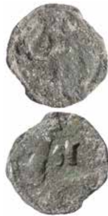
Magnus Eriksson, penning ur gruppen LL XXVII, men med bakvänt h mellan tre kronor på fränsidan. Åtsidans motiv utgörs av ett lejon vänt till vänster. Allt inom pärlling. Tidigare opublicerad variant. Funnen vid seminariegrävningar i Västergarn på Gotland. Skala 2:1.

För ytterligare kompletteringar till publicerade svenska medeltidsmynt,