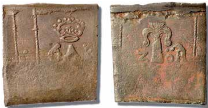
2. 2 öre 1626 (med årtalet knappt tydligt på grund av svag prägling). Ref: Ottosson, typ 24b.

endast syns upptill och till höger på åtsidan. Det förklarar också varför 2-öringens krona inte är centrerad i höjddet i förhållande till ramen.