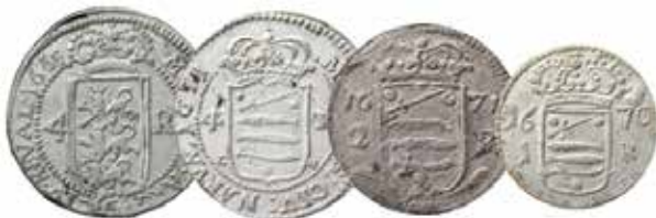
6. Nr 407, 416, 417, 420. Karl XI. Reval 4 öre, Narva 4, 2 och 1 öre. Frånsidor.

Mynten med jordglob är närmast att betrakta som provmynt. I katalogen finns historien om myntet beskrivet: Präglade myntförslag visades upp för Vitterhetsakademiens ledamöter