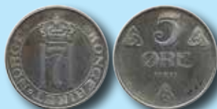
Norge. 5 öre 1917 järn 12.700:- Nytt rekord!