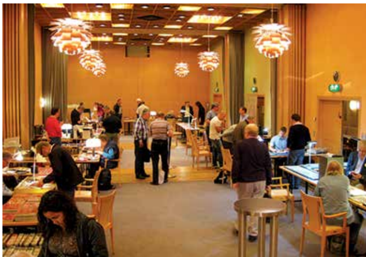
1. Vy över mässlokalen i Lund.