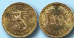
Finland. 200 markkaa 1926 13.300:-