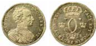
4. Nr 436. Karl XII. Stockholm. Dukat 1710.