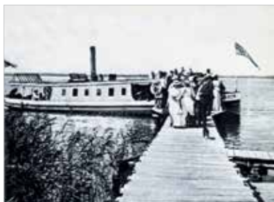
Ångslupen "Hemfärden" vid Ekenäs brygga 1905. Ur Fredell 1982.

EN AV DE VIKTIGASTE kommunala frågorna i Örebro mot slutet av 1800-talet var Örebro kanals uppdragande till stadens centrum. Hamnen låg tidigare i Skebäck, vid stadens östra del. För att förbättra sjökommunikationerna ville stadens styrande synkronisera arbetet till den stora sänkningen av sjön Hjälmararen åren 1887-1888. Arbetena med kanalen påbörjades våren 1886 och innebar bland annat byggandet av en sluss vid Skebäck. Kanalen invigdes den 24 september 1888.