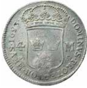
7. Nr 484. Karl XII. Riga. 4 mark 1693. Kontramarkerad.