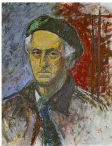
Självporträtt i olja av Rune Ekre, 2002.

Initiativet till inrättandet av museet togs av kommunen. När det ursprungliga Lödöse museum invigdes 1965 blev Rune dess förste chef. Samtidigt som han ordnade en lång rad tillfälliga utställningar var han verksam i de många grävningsschakten i