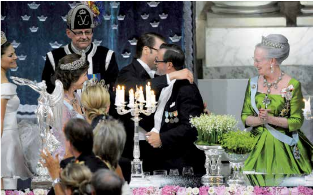
Nyblivne prins Daniel omfamnar sin pappa som hängt på sig bröllopsmedaljen efter vigseln i Storkyrkan.