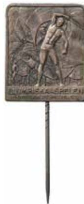
Officiellt besöksmärke med OS-affischen, silver, 21 x 26 mm.

i Stockholm till 1972. År 1877 blev Myntverket ett självständigt ämbetsverk. Verksamheten flyttade till Eskilstuna 1972 och år 1984 överfördes Myntverket till Riksbanken. Åren 2002 till 2011 ägdes verksamheten av det finska myntverket och hette Nordic Coin AB Svenska Myntverket.