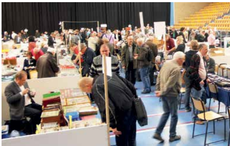
Full aktivitet under FriMynt 2012.

Minst lika viktigt som själva mässan och det som bjuds ut av närvarande handlare är allt runt verksamheten. Bara det att mer än ettusen myntintresserade befinner sig på samma plats under en och samma helg skapar förutsättningar. Många samlare har åtskilliga mil till Helsingborg, samåkning till Helsingborg innebär ofta flera timmar att diskutera mynt med likasinnade. Flera myntklubbar runt om i landet chartrar dessutom busar och plockar upp medlemmar och andra intresserade under resan. Själv har jag flera gånger åkt med Myntklubben Skilling Banco i Linköping. En trevlig resa där stämningen är hög och förväntningarna stora inför mässbesöket. En resa som också innehåller mycket prat om mynt och där många intressanta mynt "vandrar"