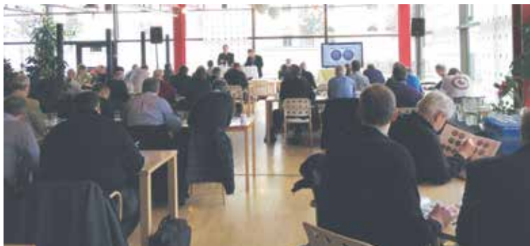
MISAB:s auktion 6 hölls i Restaurang Garnison den 10 mars i år.