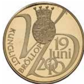
59. Bröllopsmedalj 2010 utgiven av Mynthuset Sverige i samarbete med TV4. Konstnär: Joaquin Jimenez. Kungl Myntkabinetet.