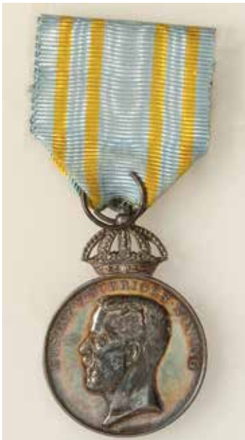
Den officiella belöningsmedaljen med Gustav V:s porträtt på åtsidan.