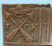
1 öre 1626 på 1625