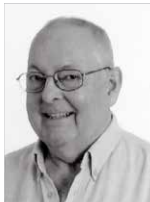
Hans Lundberg.

Den vanligaste signaturen – även hos Hans Lundberg – är "Plöjaren" (Hârith) i pytteformat på guldmynt (Nishapur). Signaturmynt är mycket sällsynta. För inte så länge sedan