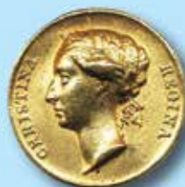
Kröningen 1650 Medalj i 7 dukaters vikt Ex. Bonde