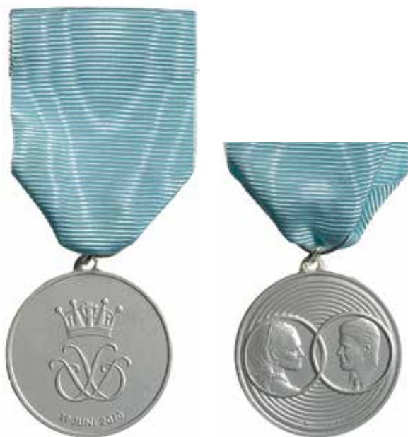
58. Bröllopsminnesmedaljen 2010 i silver med serafimerband. Konstnär: Annie Winblad Jakubowski. Kungl. Myntkabinettet.

59. Kunglig bröllopsmedalj utgiven med tillstånd av H. M. Konungen av Mynthuset Sverige i Malmö i samarbete med TV4-gruppen. Präglad hos