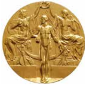
OS 1912, guldmedalj 1:a pris.

Åtsidan graverades av Myntverkets gravör Erik Lindberg. Diameter 34 mm.