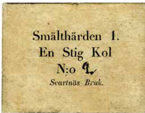
Denna papperspollett från Svartnäs bruk kommer från Sven Svenssons rika samlingar. 64 x 48 mm. Ensidig.

Ett nytt svenskt uppsving kom från 1850-talet, då nya götstalsprocesser möjliggjorde ståltillverkning i stor skala.