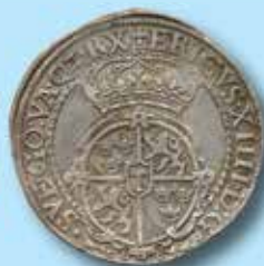
1½ mark 1562

Ett axplock redan inlämnade mynt och medaljer: