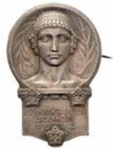
Deltagarmärket i silver som visar huvudet av en idrottsman med antik frisy.

Åtsidan graverades av Myntverkets gravör Erik Lindberg. Diameter 34 mm.