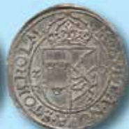
2 öre på 1 öre 1575 Off.s + 1 ex