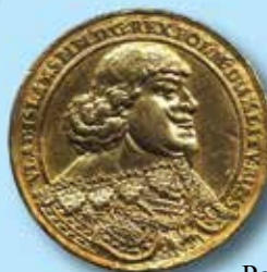
Poland Wladyslaw IV Vasa Medallic 6 ducat