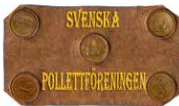
Svenska Pollettföreningens logotyp.