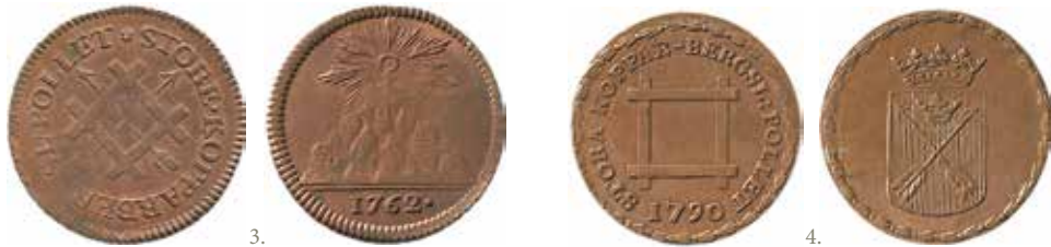
Stora Kopparbergs Bergslags polletter från 1762 respektive 1790 (6 öre kopparmynt).

Frånsida: Gruvschakt med malmtunna. Omskrift: GUD WÄLSIGNAR IORDENES DIUP. Rand: CREDIT GOD SOM PENGAR.