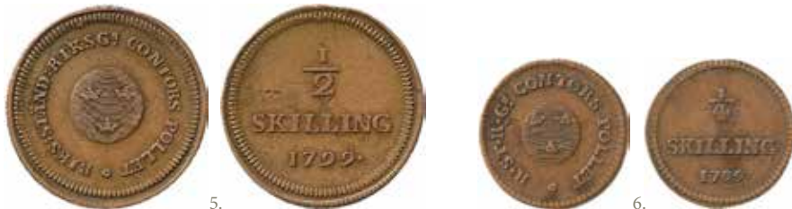
Riksgäldskontorets myntpolletter från 1799.

Frånsida: Dalavapnet omgivet av en krans som på åtsidan.