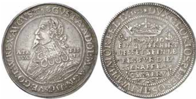
Gustav II Adolf, Osnabrück, 1 ¼ taler 1633.

SB = Ahlström, B. m.fl.: Sveriges Besittningsmynt . 1980.