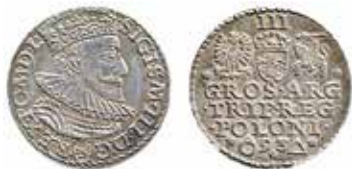
Malbork, 3 groschen 1593. Valsverkspräglad.