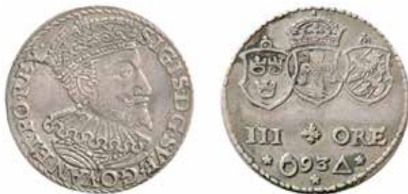
Sigismund. Malbork. 3 öre 1593. På fransidan ses myntmästarmärkena, en signettring och en triangel. Ex Bonde del 3 nr 177. Skala 1,5:1.