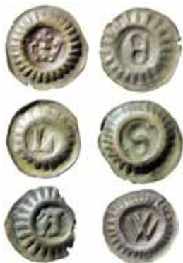
5–10. Magnus Eriksson. Brakteater med krona eller bokstav inom strålring, cirka 1354–1363.