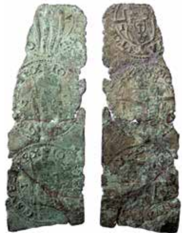
Ten med avtryck av tre valsverkspräglade 1-ören 1575. KMK 100 465.