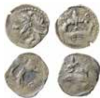
1–2. Magnus Eriksson. Penningar med lejon)(krona, cirka 1319–1340.

Under denna period slogs tvåsidiga penningar med folkungalejonet på den ena sidan och en krona på den andra. Lejonet är normalt vänster-