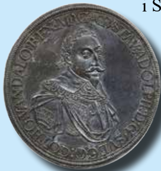
Augsburg 1 taler 1632