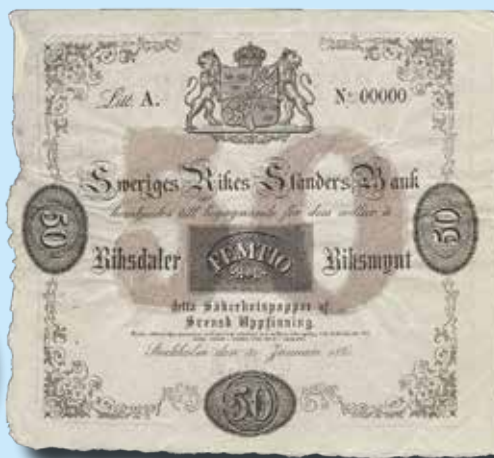
50 riksdaler riksmünt 1861 Provsedel för pappersprov