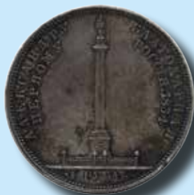
Ryssland 1 rubel 1834