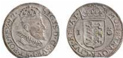
Reval, 1 öre 1597. Valsverkspräglad. Ex Bonde del 1 nr 234.