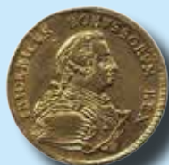
Preussen 1 friedrich d'or 1750