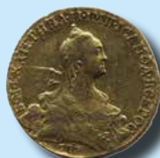
Ryssland 10 rubel 1768