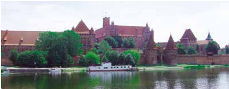
Borgen Malbork (Marienburg) i norra Polen. Här var myntverket inrättat under senmedeltiden och troligtvis också under 1500-talet.