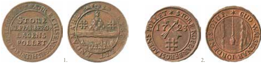
Stora Kopparbergs Bergslags polletter från 1721 (10 mark kopparmynt) respektive 1723 (5 mark kopparmynt).

1. Åtsida: STORE KOPPARBERGZ LAGENS POLLET. Omskrift: ÅHR ETTUSEND SIUHUNDRADE TIUGUETT.