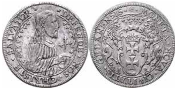
Danzig, taler 1577. Valsverkspräglad av myntmästaren Kaspar Goebel under belägringen av den polske kungen.