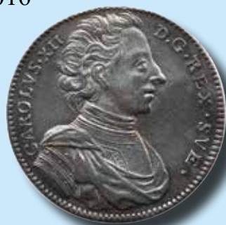
1 riksdaler 1713