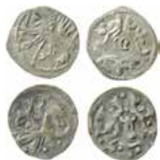
3–4. Magnus Eriksson. Penningar med lejon)(tre kronor, cirka 1340–1354.

mer. Lejonet är normalt vänstervänt, men högervänt lejon förekommer sparsamt. Även ensidiga avslag av såväl lejonsidan som sidan med tre kronor förekommer – om än ganska sällsynt.