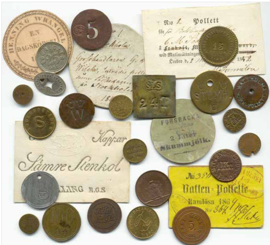
Exempel på metall- och papperspolletter från olika tider.

förening och inte hade någon juridisk status. Det var då som funderingarna på att bilda en regelrätt förening startades.