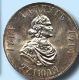
Ryssland 1 rubel 1914

Mynt och hela samlingar mottages till sommarens/höstens auktioner. Vi har mycket goda möjligheter att finna köpare till dina objekt eftersom mer än 20.000 kunder i Sverige och utlandet ser varje auktion via vår hemsida och katalogen. Kontakta oss gärna för en förutsättningslös diskussion!