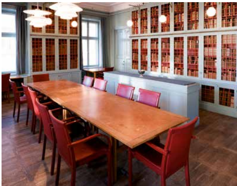
Delar av Vitterhetsakademiens rara numismatiska boksamling i Lovisa Ulrikas bibliotek på Kungl. Myntkabinettet.

Böckerna har katalogiserats i den nationella samkatalogen LIBRIS och posterna har sedan importerats till bibliotekets egen katalog VITALIS. De är alltså sökbara både i LIBRIS och i VITALIS, men posterna i den sistnämnda har utökats med information om de enskilda exemplaren. I LIBRIS kan man se att biblioteket äger boken, var den står och hur många exemplar vi har. I VITALIS ser man samma information men dessutom om det finns handskrivna anteckningar, andra exlibris och stämplor än våra