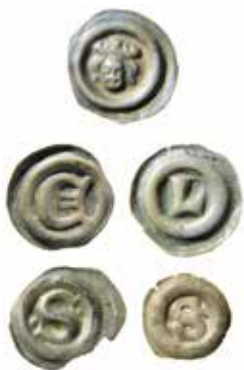
11–15. Magnus Eriksson. Brakteater med krönt huvud eller bokstav inom slät ring, cirka 1360–1363.