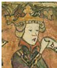
Ur Magnus Erikssons landslag.

Magnus Eriksson föddes våren 1316. Han var ende son – men hade en yngre syster, Eufemia – till Ingeborg, dotter till kung Håkan av Norge, och den ett par år senare mördade hertig Erik Magnusson. Endast tre år gammal, 8 maj 1319, ärvde den lille pojken norska kronan efter sin morfar Håkan, som avlidit samma år. Två månader senare, den 8 juli, valdes Magnus även till Sveriges kung.