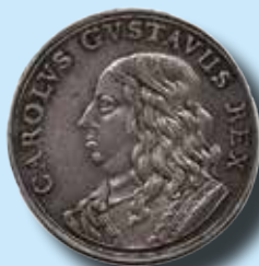
2 mark 1654 Kungens kröning