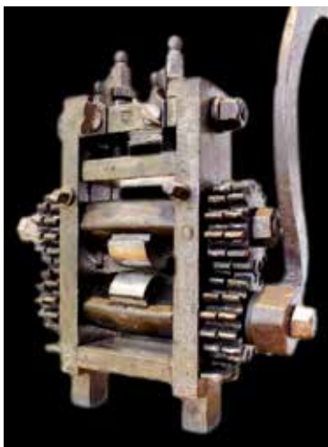
Modell av ett tidigt handdrivet valsverk för myntprägling.

Paul Gulden försökte också sälja ett liknande verk till den svenske